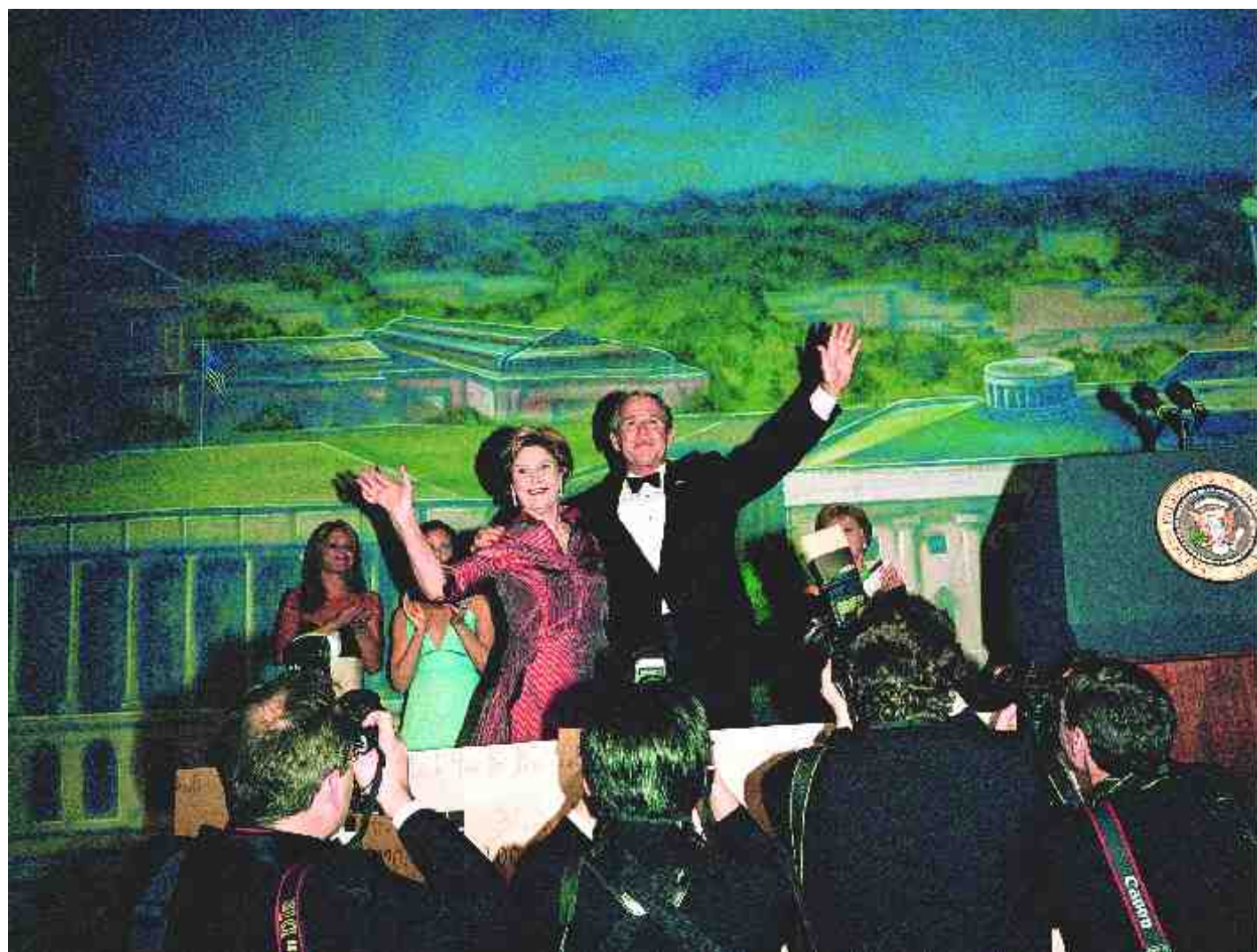
Ameriški predsednik George Bush in prva dama ZDA na predsedniškem inavguracijskem plesu (ZDA 2005).

Iz tržne perspektive fotografija gotovo ni dovolj. Revijalni trg je v upadu. Količina denarja za fotografijo in fotografske naloge ( assignment, op. av. ) je vse manjša. Zadnja tri leta z izjemo večjih novičarskih dogodkov, kot je Irak, so bila najtežje obdobje za trg fotografije. Dogajajo se zelo očitne spremembe. Kot član fotografske agencije VII ali sedaj kot član agencije Magnum opažam, da gredo številke prodaje fotografij in naročil za fotografsko delo navzdol. V Evropi je trg izsušen. Zato pri-