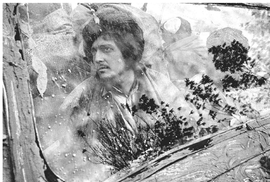
Pogled na talibskega borca skozi vetrobransko steklo luksuzne toyote (Afganistan 2001).

Ste trenirali oko, hitro ujeli trenutek, barve, kompozicijo in slikali iz roke, ne da bi pogledali skozi kukalo?