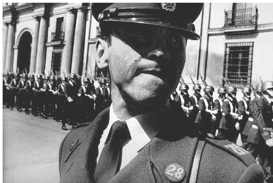
Vojaška parada v čast Augustu Pinochetu (Čile 1995).

Šlo je za vajo instinkta. Tako sem naredil nekaj zabavnih fotografij. Ko smo izbirali fotografije za knjigo agencije VII, ki smo jo naslovili Vojna , so bile te fotografije pravo veselje v vzdušju depresije. Te fotografije so bile romantične, sentimentalne, zaloznik jih je videl in takoj predlagal knjigo. V tistem obdobju so bile te fotografije nekakšna sladkarija, bonbončki med asortimajem vojnih fotografij.