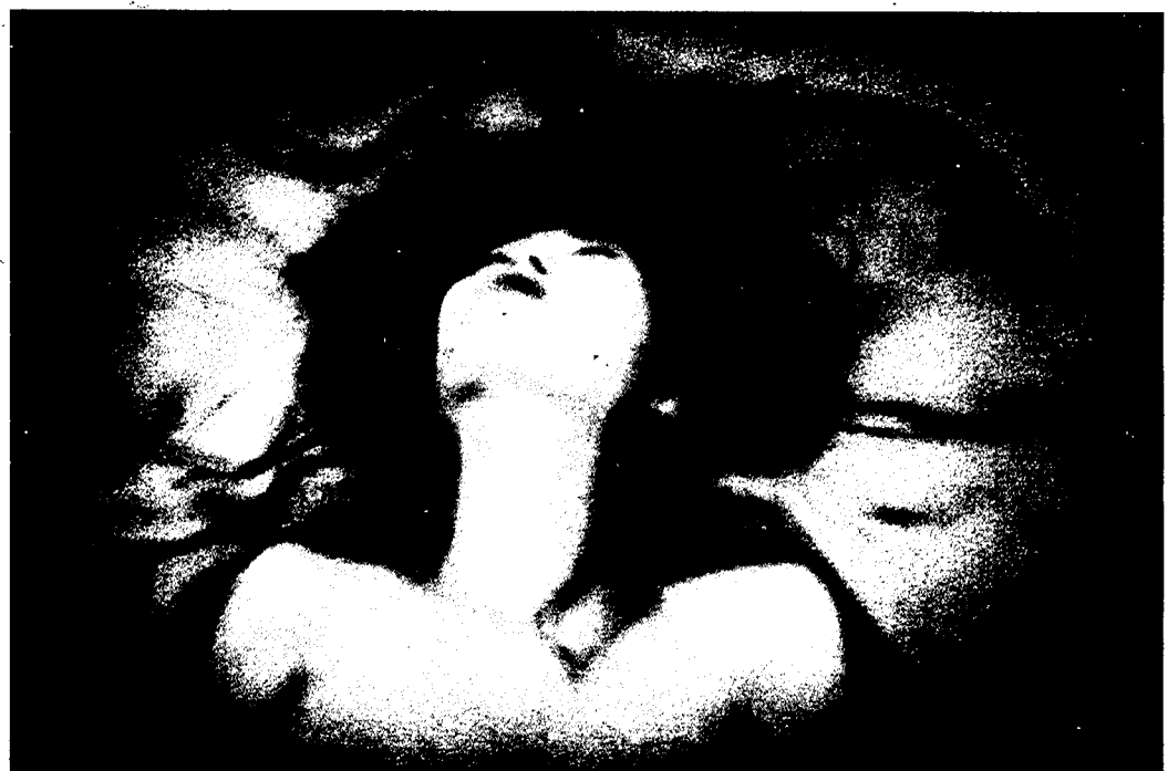
D'Agata je kot profesionalni fotograf med opravljanjem poklica, ljubimec med spolnim aktom in stranka ženske, ki prodaja svoje telo za denar.