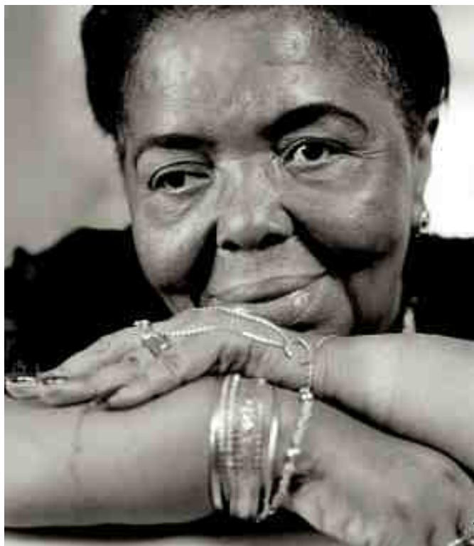
Cesaria Evora v ljubljanskem hotelu Slon.

do mojega in glasbenikovega razpoloženja. Imam več različnih pristopov k fotografiranju, od popolnoma spontanega, reportažnega načina do zrežiranih posnetkov, znotraj katerih še vedno iščem spontanost. Mnogokrat se lotevam fotografiranja tudi ekipno s kolegi osvetljevalci, maskerkami, scenografi, aranžerji ... V takih okoliščinah si vizualiziram fotografijo in se temu vedno poskušam približati s končnim rezultatom, ki seveda ni popolnoma tak, pa vendar dober. Rad imam presenečenja. No, ampak zato, da glasbenika dobite dobro razpoloženega in da ste tudi vi prave volje, je vendarle potrebne tudi nekaj sreče?